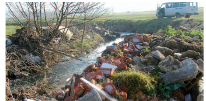
Odstranjevanje odvrženih odpadkov