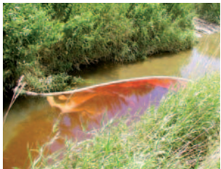
Kurilno olje v potoku