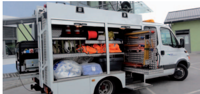
Namensko vozilo z osnovno opremo - elektro agregat, črpalka za nevarne snovi, motorna nevtralizacijska pršilka, absorbenti, razno orodje.