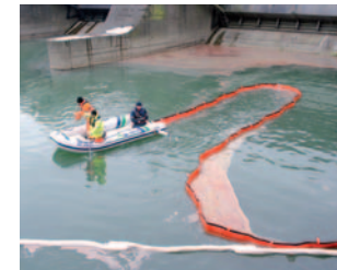
Omejevanje in preprečevanje širjenja v vodotoke in jezera izliti naftnih derivatov s postavitvijo plavajočih pregrad oz. baraž