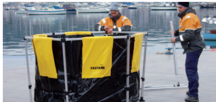
Hitropostavljiv mobilni bazen