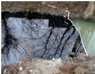
Odpadna motorna olja v potoku