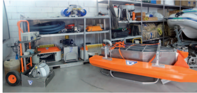
Različni posnemovalci – skimerji - z olefilnimi diski, pretočni, prelivni, sesalni ipd.

Namenska oprema za odstranjevanje naftnih derivatov z vodnih površin rek, potokov, jezer, ribnikov in morja