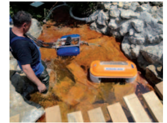
Čiščenje v vodotok izliti odpadnih olj in kurilnega olja s plavajočim namenskim posnemalec s pomočjo olefilnih diskov