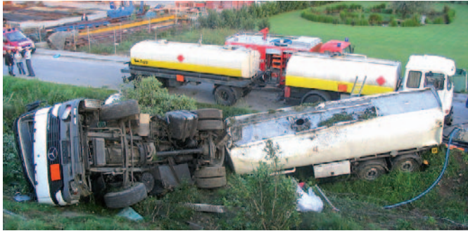
Prometna nesreča avtocisterne in izlitje kurilnega olja

Vsako onesnaženje je posledica človeške dejavnosti